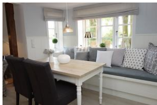
...ein Plätzchen für den Kaffee zwischendurch....