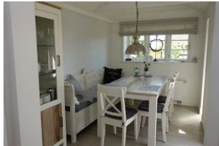
Der herrliche Essplatz im Anbau mit Blick in den Garten und Zugang zur hinteren Terrasse