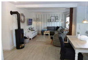
...der Blick in die gemütliche Sitzecke