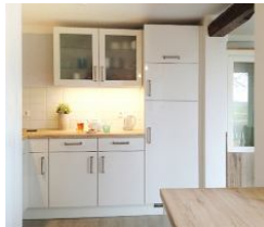
...und der andere Teil für Geschirr etc.