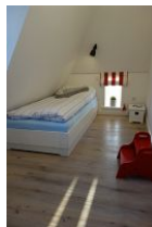
Das Kinderzimmer verfügt über zwei Einzelbetten, 90x200cm