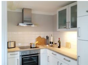
...und die Elektrogeräte dürfen natürlich auch nicht fehlen.