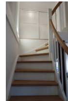
Die Treppe ins Obergeschoß