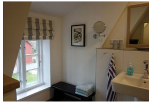
Das Bad im OG mit Handwaschbecken....