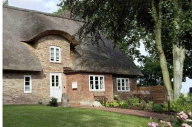
Das Haus WattGut in Oevenum

Die Unterkunft verteilt sich über EG und 1.OG.