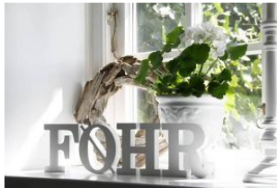
FO E H R