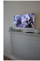
...Flachbild - TV - Gerät