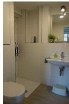
Das Duschbad im Erdgeschoß