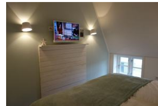
... ebenfalls mit Flachbild - TV - Gerät