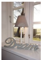
I had a dream.....