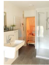
... und Duschkabine. Die Sauna steht Ihnen kostenfrei zur Verfügung !