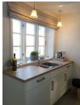
Ein Teil der Küchenzeile.