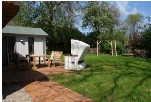
Die Terrasse hinter dem Haus mit dem Garten - nur für Sie zu nutzen. Der Austritt auf die Terrasse befindet sich im Essbereich