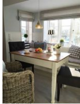
...der kleine Essplatz.....