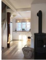
Der Blick vom Wohnzimmer zur Küche, vorbei am dänischen Ofen.