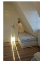
...eins versteckt in einer Nische, dies ist nur 85cm breit, aber auch 200cm lang