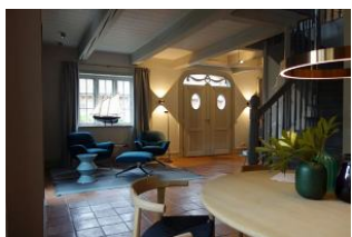
Der Blick zur Haustür

Dieses traumhafte Hausteil wurde im Frühjahr 2020 komplett saniert und neu eingerichtet. Seien Sie gespannt auf ein großzügiges Erdgeschoß mit offenen Räumen ohne störende Türen (friesischer Rundgang), tolles Ambiente, moderne Einrichtung, technische Raffinessen (5x Sonos Box) Küchenschränke mit Touchfunktion, Vollflächiger Induktionsherd, Sauna im Bad im OG, zwei Schlafzimmer mit großen Doppelbetten, eins mit zweiten TV Gerät. Durch dies Haus muß man einmal durchgehen, alles ausprobieren, sich setzen und auf sich wirken lassen. Toll, seien Sie gespannt auf dieses 5 Sterne Haus !