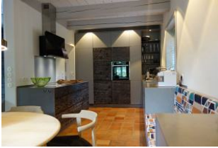
Die offene, hochmoderne Küche...