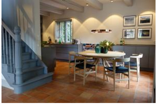
Der Essplatz mit Blick zur TV - Sitzecke oder zur Küche