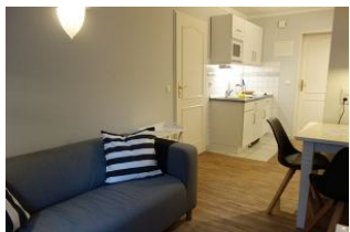
Der kleine Wohnraum mit Couch, Essplatz, Blick in die Küche

Ruhig gelegen, inmitten unseres kleinen Städtchens Wyk finden Sie unser Haus Hallig Hooge, welches insgesamt 7 Wohnungen für jeweils 2 Personen beherbergt. Auch die kleine Wohnung "Südfall" bietet Ihnen den Urlaubskomfort, den Sie suchen. Wohnbereich mit offener Küchenzeile, Duschbad und ein sep. Schlafzimmer mit zwei Einzelbetten machen Lust auf einen schönen, erholsamen Urlaub.