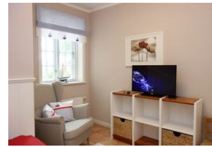
Der Sessel und ein zweites TV Gerät im Kinderzimmer