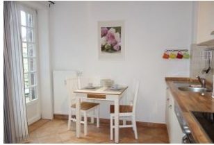
...der Essplatz, links der Austritt auf die Terrasse