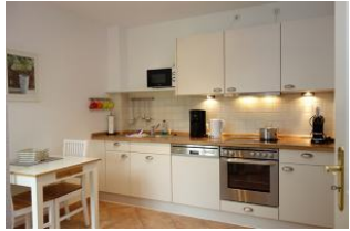
Ein zweiter Essplatz in der Küche und ein Teil der Küchenzeile.