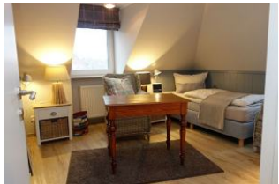
Das Kinderzimmer mit 2 Einzelbetten und Tisch