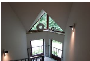
Das Treppenhaus im Haus Neshörn