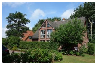
Haus Neshörn in Wyk im Sommer Die Unterkunft befindet sich im 1.OG

Das Haus Neshörn ist zu erreichen über die Straße "Am Leuchtturm" Hausno. 4 liegt gemeinschaftlich mit der "Strandvilla" auf einem großen Grundstück der Familien Buchner/Petersen. Die Whg. 3 (Rüm Hart) befindet sich im 1. und 2. OG des Hauses und hat ausreichend Platz für 4 Personen. Großer Wohn/Essraum mit offener Küche im 1.OG sowie ein Doppelschlafzimmer und das Duschbad. Im 2.OG befindet sich das zweite Schlafzimmer mit großem Doppelbett und einem weiteren Bad mit WC und Handwaschbecken. Der Clou: ein herrlicher Balkon, der Ihnen die Nachmittags- und Abendsonne beschert.