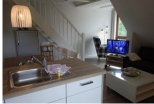
Der Blick von der Küche aus.