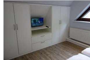
...auch hier viel Stauraum und ein kleines TV - Gerät