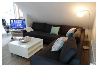
...hier finden alle Familienmitglieder ein Plätzchen