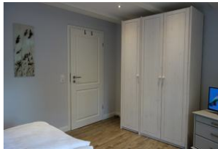
... und viel Stauraum im großen Kleiderschrank.