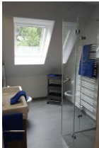
Das moderne Duschbad... (nicht im Bild: die Toilette)