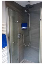
...die Duschkabine mit Echtglaswänden und Bodenablauf.