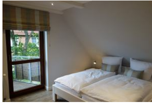
Das große Doppelbett im Schlafzimmer, Austritt auf den Balkon....