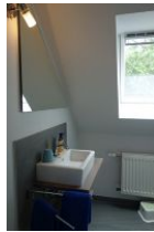
Im Dachgeschoß ein kleines Bad mit Handwaschbecken und ...