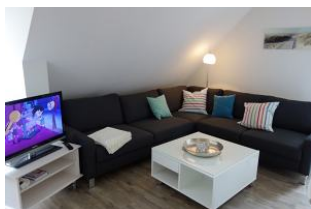
Eine große Sitzecke....