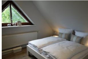
Das Schlafzimmer im Dachgeschoß...