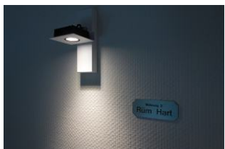
Die Wohnung 3 - Rüm Hart lädt ein .....