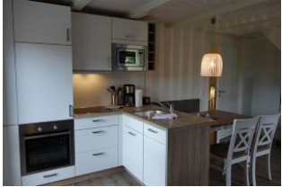
...an die Küche