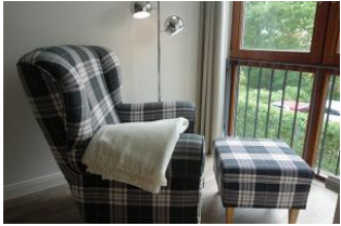
Einladend .... ein gemütliches Plätzchen