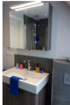
...Waschtisch und Schrank für alle kleinen und großen Badutensilien....