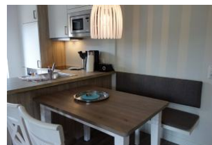
.Der Esstisch - Anschluss.....