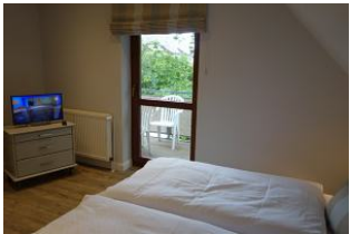
...ein kleines TV - Gerät...