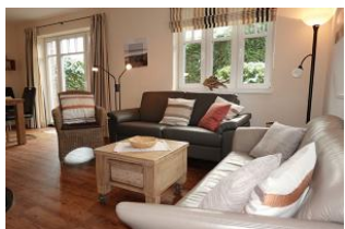
Zwei Sofas garantieren einen gemütlichen Abend

Dieses Einzelhaus in der Flurstrasse in Wyk, läßt Urlaubsherzen höher schlagen. Herrlich für Familien. Vier Schlafzimmer geben jedem Familienmitglied eine Rückzugsmöglichkeit. Der gemeinsame Wohn- Essraum mit halb offener Küche dient der Kommunikation. Zwei Bäder lassen auch am Morgen nicht das Frühstück in unendliche Ferne rücken. Das Fensteröffnen zum lüften ist nicht nötig, das Haus verfügt über eine zentrale Lüftungsanlage, die einen hohen Komfort der Raumluft garantiert. Hier wurde an Alles gedacht, seien Sie gespannt. Ach übrigens, sind Sie vielleicht Schachspieler ? Im Garten befindet sich ein 4x4 m großes Schachfeld aus Steinplatten, den Schlüssel zum Schrank für die großen Figuren bekommen Sie bei uns !