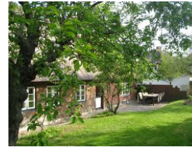
Der großzügige Garten hinter dem Haus, herrlich eingewachsen