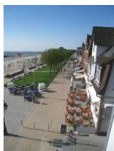
Der Blick auf den neu gestalteten Sandwall

In diesem, fast 100 Jahre alten Stadthaus wohnt man wirklich "mittendrin". Auf der geschlossenen Veranda, die Wind und Wetter abhält, den Blick auf die Promenade aber freigibt, könnte man den ganzen Tag verbringen. Den Menschen zusehen, entfernt die "Kurmusik" hören, aufs Meer schauen - eben einfach die Seele baumeln lassen. Das ist Erholung pur. Die modern eingerichtete Wohnung mit dem Charme alter Gemäuer liegt im 2.OG des Hauses und bietet 2 Personen ausreichend Platz für einen erholsamen Urlaub. Aber Achtung: dies alte Haus hat auch alte Treppen. Lang, steil und kurze Stufen. Allein vom Hauseingang in die 1.Etage müssen Sie 17 Stufen bewältigen.