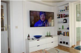
Großes TV Gerät für den gemütlichen Abend