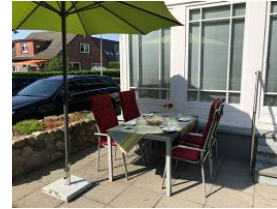
...nehmen Sie Platz, hier gibts Kuchen.....(nicht im Angebot enthalten)