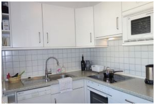
Die sep. Küche mit allem was man so braucht...