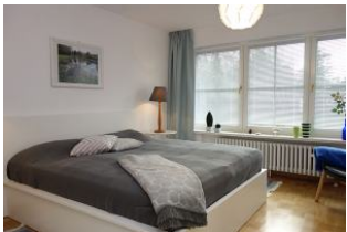
Großes Doppelbett 180x200cm ohne Fussteil...