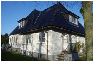
...man muss einmal um das Haus gehen um zum Eingang - ein paar Stufen hoch - zu kommen. Links "Ihre" Terrasse im Winterschlaf.

Die Wohnung 1 im Erdgeschoss des Hauses Schwalbenweg 10 in Wyk! Herrlich, großzügige Wohnung im Erdgeschoss für 2 Personen. Das Wohnzimmer mit gemütlicher Couch und Lesesessel, im Wintergarten ein großer Essplatz, sep. vollständig eingerichtete Küche, das Schlafzimmer mit großem Doppelbett 180x200 ohne Fussteil und ein Duschbad. Ruhe pur im Schwalbenweg, der Südstrand fußläufig zu erreichen, der Bäcker "um die Ecke".....so muss Urlaub sein.