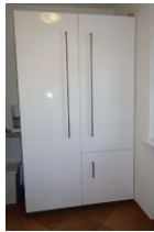
... der große Schrank beherbergt noch Geschirr und hat viel Platz für Lebensmittelreserven.