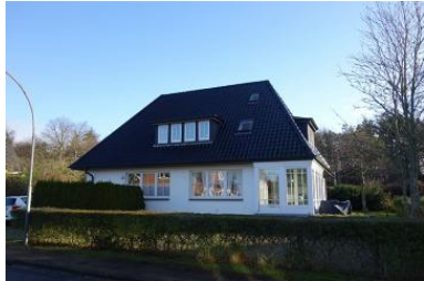
Das Haus Schwalbenweg 10 Die Whg. 1 befindet sich rechts im Haus