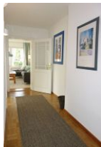
...am Ende des Flures das helle Wohnzimmer...