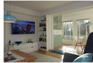
Der Blick von der Couch zum TV