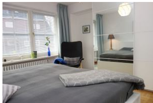
...Spiegel-Kleiderschrank für Kofferinhalte.