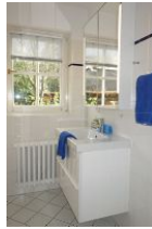
Das Bad mit Handwaschbecken, Toilette und .....