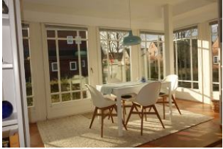
Der herrliche Wintergarten mit dem großen Essplatz....