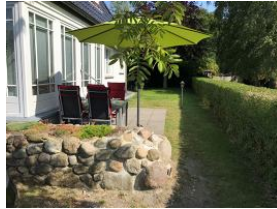
Ein herrlicher Terrassenplatz vom Wohnzimmer aus zu begehen.