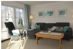
....mit gemütlicher Couch "zum langmachen"