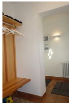
Treten Sie ein, Sie sind angekommen.