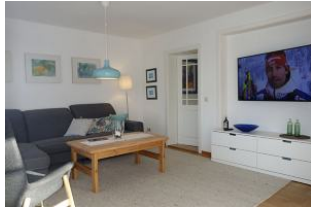
....hier noch einmal das Wohnzimmer