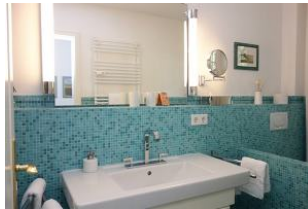
Neues Bad im Erdgeschoß mit türkisfarbenen Mosaikfliesen, großem Waschtisch...