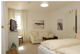
Das zweite Schlafzimmer im Untergeschoß, ebenfalls mit Betten 160x200cm