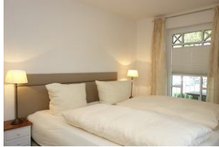
Das Schlafzimmer im Erdgeschoß mit Boxspringbetten 180x200cm