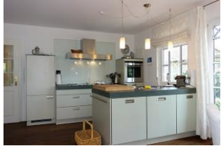
Die neue Siematic Küche hält sämtliche Küchenutensilien bereit