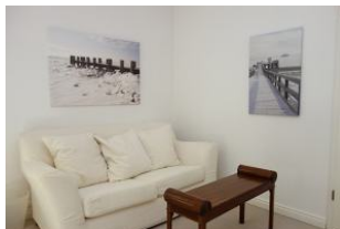
...herrlicher Rückzugsort zum faulenzten....