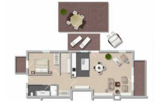
Der Grundriss der Wohnung

Die rückwärtige Ansicht des Hauses. Die Wohnung befindet sich links im Erdgeschoß. Der kleine Balkon gehört zur Wohnung