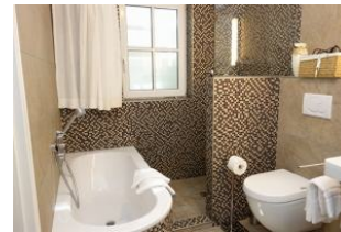
...Badewanne und offene Dusche, Toilette