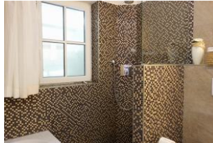
...hier noch einmal die Dusche