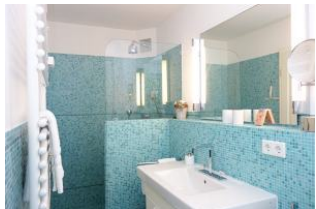
...und offener Dusche, nicht im Bild: die Toilette