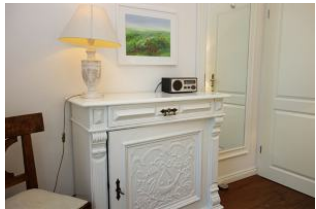
Kommode im Schlafzimmer