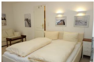
...hier noch einmal die Betten, die Tür führt ins zweite Bad.

Entfernungen, zirka: zum Bäcker 20 m, zur Einkaufsmöglichkeit 200 m, zum Flugplatz 1,2 km, zum Golfplatz 1,4 km, zum Hafen 1,5 km, zum Meer 80 m, zum ÖPNV 300 m, zum Badestrand 80 m, zum Ortszentrum 1,2 km