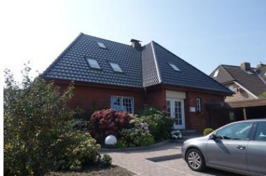
Die Außenansicht des Hauses Baben Dörp 13 in Wyk Boldixum