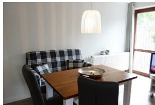
Der Essplatz mit kleinem Sofa....