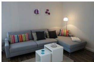
...hier darf man es sich gemütlich machen !