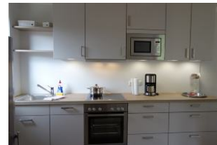
Die Küchenzeile, hell + freundlich mit viel Platz !