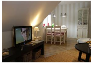
Ein Essplatz am Fenster, hier läßt sich auch wunderbar Urlaubspost erledigen.