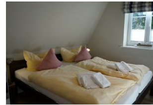
Das Doppelbett im Schlafzimmer mit ...