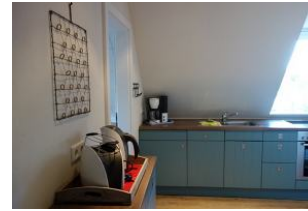
Ein Teil der offenen Küchenzeile...