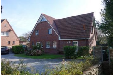
Die Unterkunft befindet sich im 1.OG.