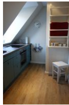
...und der andere Teil.