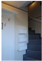
...herein spaziert ....

In unserem neuen Haus Eltimjo befindet sich eine "schnuckelige" Ferienwohnung für 2 Personen. Wohnzimmer, Schlafzimmer, offene Küchenzeile und Duschbad. Herrlich gemütlich im Dachgeschoß. Freisitz mit Strandkorb und Möbeln. Diese Wohnung - gemeinsam gemietet mit dem Haus Eltimjo - eignet sich besonders für Familien. Hier kann man sich ein wenig zurückziehen, wenn es im Haus zu "trubelig" wird.