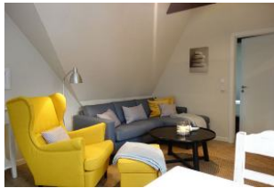
..gemütlich und farbenfroh - die Sitzecke