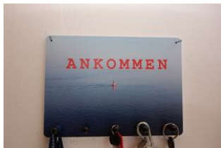
A N K O M M E N - Willkommen !