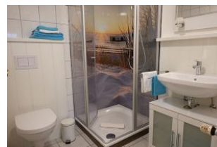
...die Dusche, niedrige Duschwanne