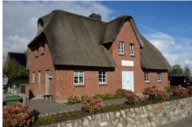
Das Doppelhaus "Golfoase"

Die Unterkunft verteilt sich über EG, 1.OG und DG.