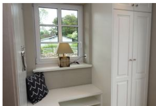
Treten Sie ein, ein kleiner Flur mit Sitzbank erwartet Sie...