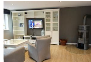
Herrlich ....ein Ofen. Holz gibts im REWE-Markt