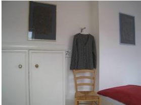
Der Schrank bietet genügend Stauraum