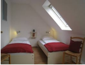
Das Kinderzimmer mit zwei Einzelbetten, die sich problemlos zusammen schieben lassen (Hotelbetten)