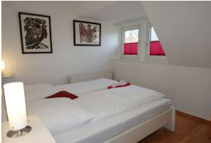
Das Elternschlafzimmer mit großem Doppelbett 180x200cm und ...