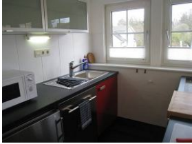
.. mit allem Drum und Dran...