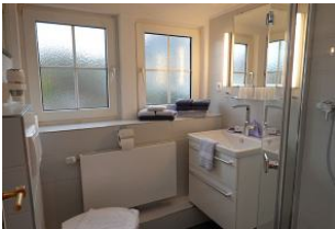
Das Badezimmer mit Waschbecken, Dusche und Toilette....