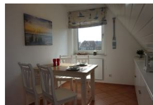
Der Essplatz im Wohnzimmer