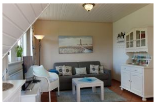
Gemütliche Couch zum erholen nach einer langen Fahrradtour ?....