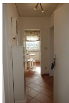
Treten Sie ein ....