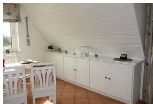
Sidebord für düt un dat.....