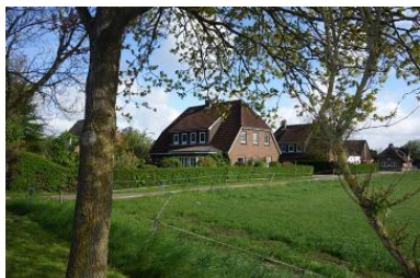
Das Haus Hardesweg 9 in Wrixum