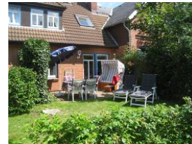
Die Terrasse schön eingewachsen. Strandkorb, Liegen, Terrassenmöbel.