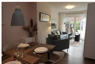
Der Essbereich und Blick in den Wohnbereich.