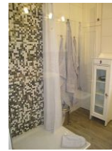
Die Dusche mit Echtglaswand, an der kurzen Seite mit Duschvorhang