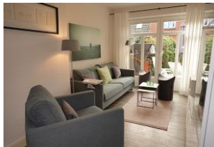
... noch einmal der Wohnbereich