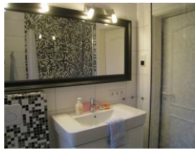
Im Duschbad ein großer Spiegel...