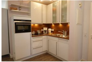
...wer kocht heute ?