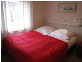
Ein Schlafzimmer, mit Fenster zum Parkplatz. 2 Betten a 90x200m