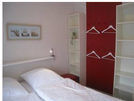
Weisse Regale, rote Paneelwand - farbenfrohes Schlafzimmer für die Kinder.