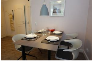
...noch einmal der gedeckte Tisch, im Hintergrund die Türen ins Kinderschlafzimmer und ins Bad.