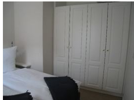
... und der große Einbauschränk