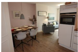
...kommen Sie herein.....

Zauberhafte Wohnung im Erdgeschoss. Klein aber fein ! Diese Wohnung hat alles, was man benötigt für einen Familienurlaub. Zwei Schlafzimmer mit bequemen Einzelbetten (Hotelbetten), die zusammen oder auseinander gestellt werden können, ein gemütliches Wohnzimmer mit Austritt auf die Terrasse. Offene Küchenzeile, großer Essplatz, Duschbad. Super Lage zum Strand (ca. 300m)....und das Tollste: im Nachbarhaus auf gleichem Grundstück befinden sich ein kleines Schwimmbad und Fitnessraum (kostenfrei zu nutzen) sowie eine Sauna - zur Nutzung derselben bekommen Sie bei uns im Büro passende Münzen.