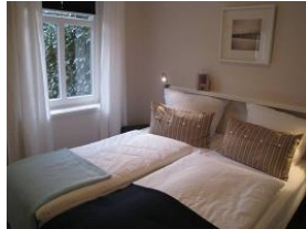
Das zweite Schlafzimmer mit Fenster zum Garten.