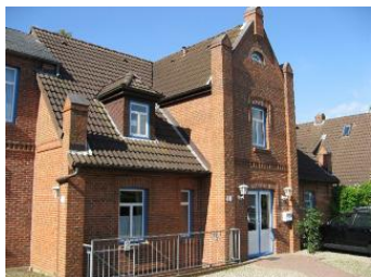
Die Aussenansicht des Hauses Badestr. 40