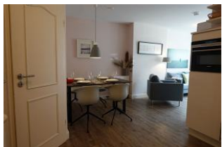
...hier noch einmal. Die Tür führt ins Kinderschlafzimmer.