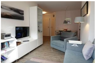
Der Wohnbereich mit Blick zum Esstisch.