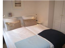
Hier noch einmal die Betten, je 90x200m