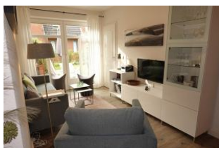
...der gemütliche Wohnbereich...