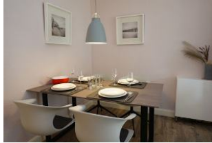
Der gedeckte Tisch...