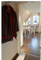
Der kleine Flur mit Garderobe