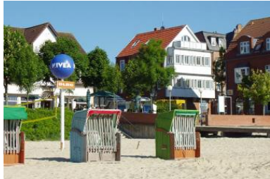
Das Haus Mittelstr.2/Ecke Sandwall