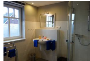
Das Duschbad im Obergeschoß mit .....