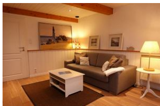
...hier noch einmal die Couchecke...