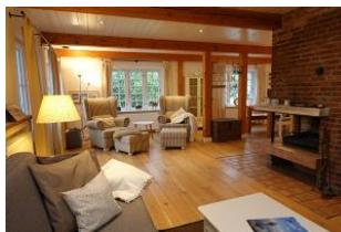
...gemütliche Couch, 2 Sessel und der Kamin - was braucht man mehr ?