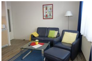
Couch und Sessel laden zu gemütlichen Stunden ein.