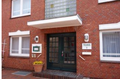
Das Haus Teunis in der Mühlenstr. 9 / Ecke Carl-Häberlin-Str. in Wyk