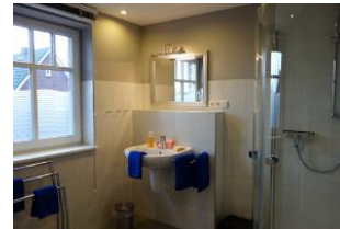
Das Duschbad im Obergeschoß mit ....