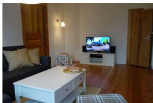
....vielleicht auch Fernseh - Abend ???