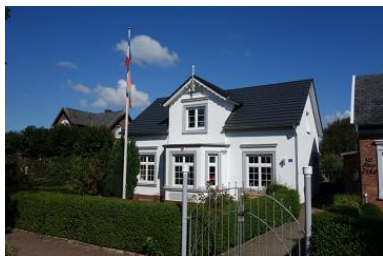
Villa Hansson, Boldixumer Str. 14 in Wyk auf Föhr