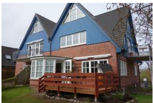
Das Haus Olhörnstieg 6 vom Garten aus gesehen. Die Holzterrasse gehört zu "Ihrer" Wohnung.