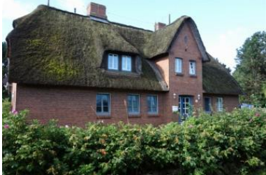
Das Haus Bredland 2a Die Whg.4 befindet sich im 1.OG links