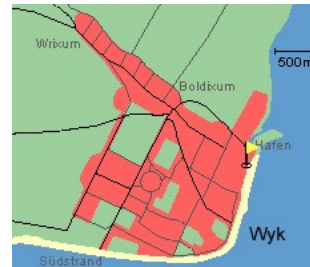
Entfernungen, zirka: zum Bäcker 30 m, zur Einkaufsmöglichkeit 350 m, zum Flugplatz 3,0 km, zum Golfplatz 3,0 km, zum Hafen 600 m, zum Meer 50 m, zum Badstrand 50 m, zum Ortszentrum 50 m