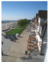
Der Blick auf den neu gestalteten Sandwall

In diesem, fast 100 Jahre alten Stadthaus wohnt man wirklich "mittendrin". Auf der geschlossenen Veranda, die Wind und Wetter abhält, den Blick auf die Promenade aber freigibt, könnte man den ganzen Tag verbringen. Den Menschen zusehen, entfernt die "Kurmusik" hören, aufs Meer schauen - eben einfach die Seele baumeln lassen. Das ist Erholung pur. Die modern eingerichtete Wohnung mit dem Charme alter Gemäuer liegt im 2.OG des Hauses und bietet 2 Personen ausreichend Platz für einen erholsamen Urlaub. Aber Achtung: dies alte Haus hat auch alte Treppen. Lang, steil und kurze Stufen. Allein vom Hauseingang in die 1.Etage müssen Sie 17 Stufen bewältigen.