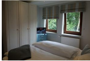
...Einbauschränke und kleinem TV-Gerät