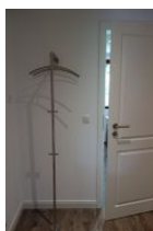
Der Flur mit Garderobe