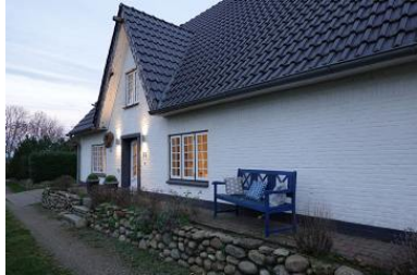
Die Aussenansicht des Hauses Friesengeist in Wrixum, Ohl Dörp 25

Die Unterkunft verteilt sich über EG und 1.OG.