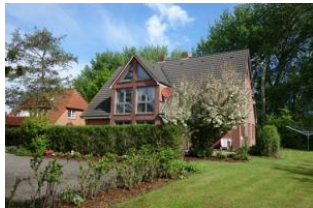
Das Haus Neshörn, Am Leuchtturm 4 in Wyk

Das Haus Neshörn ist zu erreichen über die Straße "Am Leuchtturm" Hausno. 4 liegt gemeinschaftlich mit der "Strandvilla" auf einem großen Grundstück der Familie Buchner/Petersen. Die Whg. 1 (Rungholt) befindet sich im EG mit herrlicher Süd - Terrasse. Der große Wohnraum mit offener Küchenzeile, das Schlafzimmer mit großem Doppelbett, das moderne Duschbad und nicht zuletzt die Nähe zum Strand, lassen das richtige Urlaubsfeeling aufkommen.