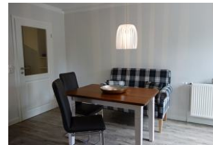
...oder auch mit bequemen, freischwingenden Stühlen.