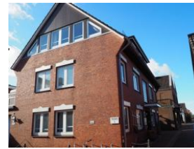
Ansicht Haus Teunis Car-Häberlin-Str.