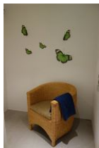
...und gemütlichem Sessel zum ausruhen