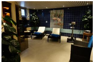
Der Fitnessbereich im Untergeschoß mit ...