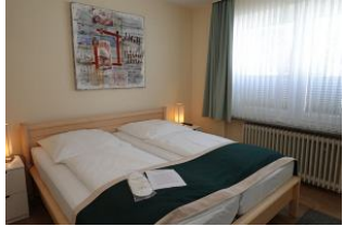
Das große Bett misst 180x200cm