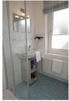
Das Bad mit Handwaschbecken und ...