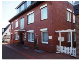
Ansicht Haus Teunis Mühlenstr.