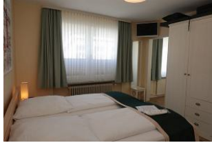
im Schlafzimmer ein großes Fenster und ein zus. TV Gerät