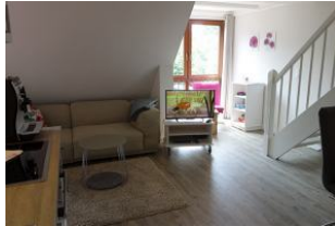
Das Wohnzimmer, die Treppe führt in das Schlafzimmer im Dachgeschoß