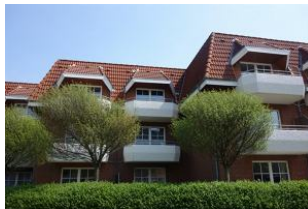
Der Balkon liegt etwas zurück