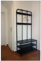
Die Garderobe im Flur.

Hier stellen wir Ihnen die linke Doppelhaushälfte des Hauses Adebar in Oevenum vor. Geschmackvoll eingerichtet bietet sie 4 Pers. ausreichend Platz für einen erholsamen Urlaub. Für Besuch stehen zwei weitere Schlafplätze zur Verfügung. Im Erdgeschoss befinden sich Wohn/Ess- und Küchenbereich sowie das Gäste - WC. Im Obergeschoss 2 Schlafzimmer sowie das große Bad mit Dusche und Badewanne. Genießen Sie die Ruhe des kleinen Inseldorfes Oevenum mit 600 Einwohnern, einem Bäcker, einem Einkaufsladen sowie dem Dorfkug der hervorragende Hausmannskost anbietet.