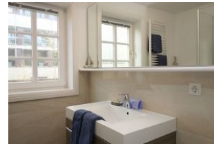
Das Duschbad im Obergeschoß