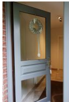
Treten Sie ein, das neu gestaltete Haus Neshörn erwartet Sie ....