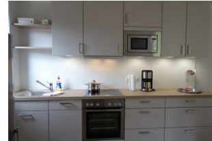
Die Küchenzeile, hell + freundlich mit viel Platz !