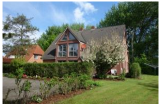
Das Haus Neshörn, Am Leuchtturm 4 in Wyk

Das Haus Neshörn ist zu erreichen über die Straße "Am Leuchtturm" Hausno. 4 liegt gemeinschaftlich mit der "Strandvilla" auf einem großen Grundstück der Familie Buchner/Petersen. Die Whg. 1 (Rungholt) befindet sich im EG mit herrlicher Süd - Terrasse. Der große Wohnraum mit offener Küchenzeile, das Schlafzimmer mit großem Doppelbett, das moderne Duschbad und nicht zuletzt die Nähe zum Strand, lassen das richtige Urlaubsfeeling aufkommen.