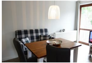
Der Essplatz mit kleinem Sofa....