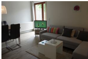
Das TV-Gerät steht auf einen Rollwagen.