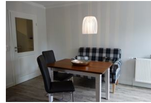
...oder auch mit bequemen, freischwingenden Stühlen.