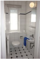
Das Gäste-WC im Erdgeschoss