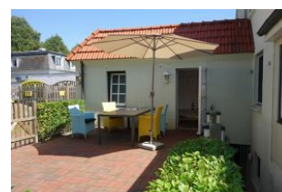
Die Terrasse noch einmal von der anderen Seite.