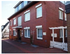
Ansicht Haus Teunis Mühlensstrasse