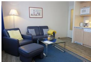
Gemütlicher Sessel und Couch