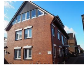
Ansicht Haus Teunis Carl-Häberlin-Str. Der Eingang ins Haus befindet sich rechts am Haus, die Garageneinfahrt links am Haus