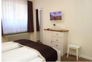
Kommode und TV Gerät