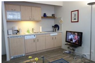
Tv Gerät und die Küchenzeile