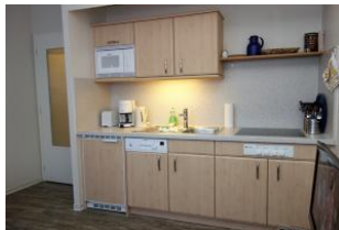
Hier noch einmal die Küchenzeile