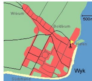
Entfernungen, zirka: zum Bäcker 70 m, zur Einkaufsmöglichkeit 150 m, zum Flugplatz 3,0 km, zum Golfplatz 3,0 km, zum Hafen 300 m, zum Meer 100 m, zum ÖPNV 300 m, zum Badestrand 100 m, zum Ortszentrum 20 m