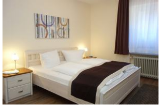
Das großzügige Schlafzimmer mit Doppelbett 180x200cm Laminatfußboden