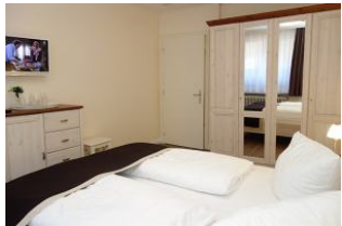
...und viel Stauraum für die Kofferinhalte