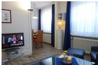
Der Blick ins Wohnzimmer und Esszimmer

Das Haus Teunis wird vielen unserer Gäste bekannt sein. Mittendrin und überall dabei. Kurze Wege zum Bäcker, zum einkaufen, zum Strand, zu den Lokalen - einfach überall hin, zu Fuß - herrlich ! Das Haus bietet 6 Wohnungen, zwei davon mit großer Dachterasse, für je 2-3 Personen. Der Clou: Die Doppelgarage im Haus kann und darf von den Gästen genutzt werden. Rechtzeitiges Buchen ist allerdings unbedingt erforderlich. (Tagessatz 3,00 Euro) Die Whg. 1 im Erdgeschoß des Hauses bietet drei Personen Platz, schauen Sie selbst.