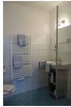
Das Duschbad, links im Bild die Toilette...