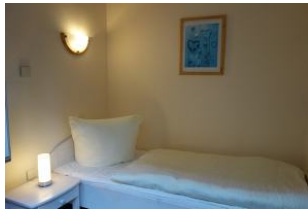
Das kleine Einzelschlafzimmer, nur durch das Elternschlafzimmer zu begehen.