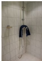
... Dusche und ...