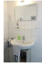
...Handwaschbecken und Ablagemöglichkeiten