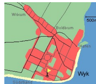
Entfernungen, zirka: zum Bäcker 20 m, zur Einkaufsmöglichkeit 200 m, zum Flugplatz 1,2 km, zum Golfplatz 1,4 km, zum Hafen 1,5 km, zum Meer 80 m, zum ÖPNV 300 m, zum Badstrand 80 m, zum Ortszentrum 1,2 km