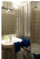
Das Bad mit Handwaschbecken und Dusche...