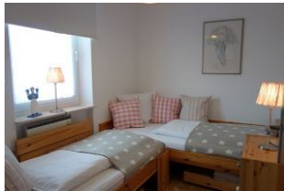
Das Schlafzimmer, Betten über Eck