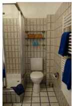
...Toilette und Handtuchheizung.