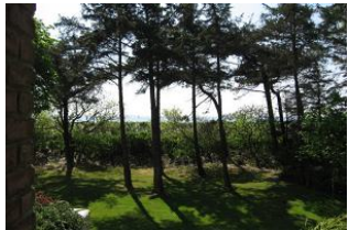
...zwischen den Bäumen hindurch den Meerblick. Man kann es nicht immer sehen, aber riechen und hören !