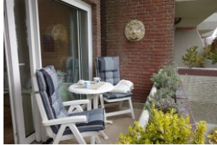
Lassen Sie die Seele baumeln und genießen Sie...