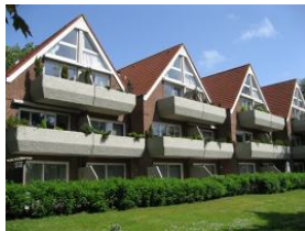
Die rückwärtige Ansicht des Hauses Olhörnweg 1 Die Balkone sind versetzt gebaut, so stört kein Gast den Anderen.