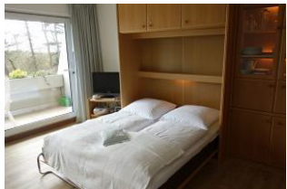
Und wenn Sie getrennt schlafen möchten oder Besuch bekommen, auch im Wohnzimmer gibt es zwei herrliche Betten, tagsüber im Schrank versteckt.