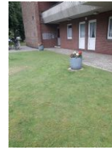
Blumenkübel vor dem Haus.