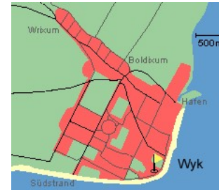
Entfernungen, zirka: zum Bäcker 400 m, zur Einkaufsmöglichkeit 1,0 km, zum Flugplatz 2,7 km, zum Golfplatz 2,7 km, zum Hafen 1,7 km, zum Meer 50 m, zum Badstrand 50 m, zum Ortszentrum 1,0 km