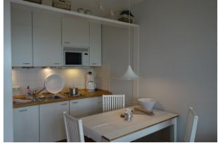
...mit Essplatz Küche mit 2 - Platten - Herd