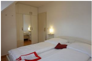
... großem Einbauschränk.