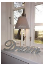
I had a dream.....