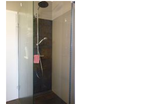
...und bodengleicher Dusche