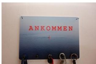
A N K O M M E N - Willkommen !