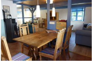
Der Essplatz, kurze Wege zur Küche