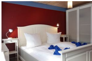
...und ausreichend Schrankraum