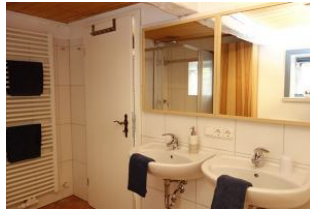
Das großzügige Bad mit Handtuchheizung und zwei Waschtischen....