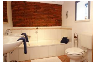
...Badewanne und Toilette ....