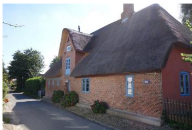
Das Haus Holm 17